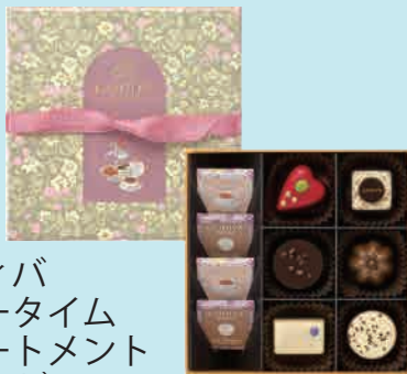
サブレ ショコラ 桜(10個入)